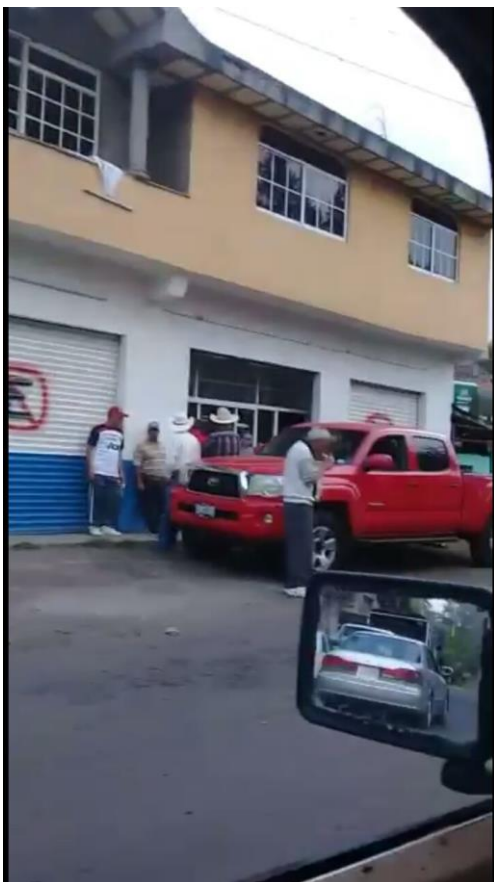
g) Imagen 5