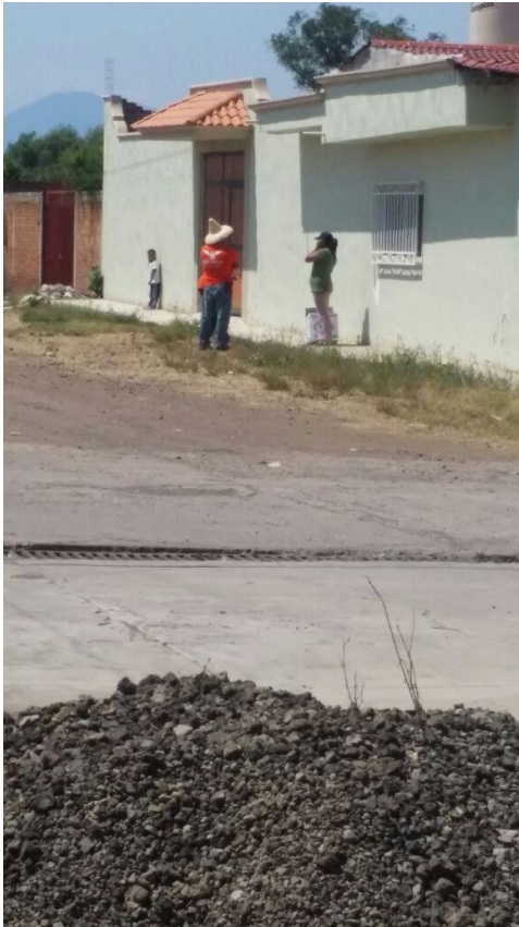
e) Imagen 3