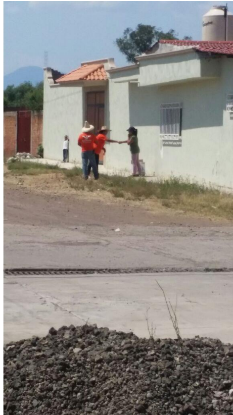
f) Imagen 4